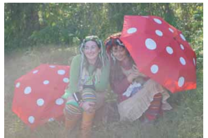
Peikot tiirailivat messuvieraita suurten karpässienten suojasta.