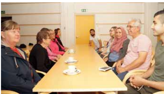
Tervolalaiset ja syyrialaiset pääsivät leppoisan jutustelun makuun tiedotustilaisuuden päätteeksi.