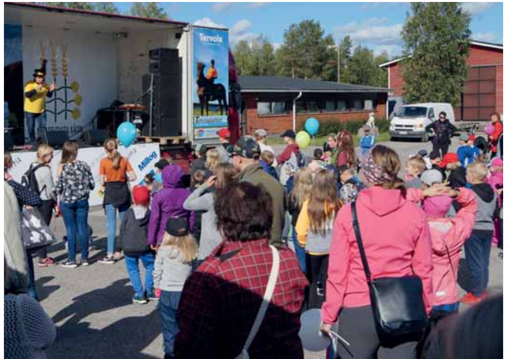
Pikkuväki odottaa hartaasti karkkitykin laukaisua.

- Lähialueilla järjestettävät tapahtumat vaikuttavat tietysti ihmisten haluun ja mahdollisuuksiin lähteä moniin kesän tapahtumiin. Tällaisten messujen tulevaisuus on hyvin pitkälle kiinnostavien uudistus- ja kehitysideoit-