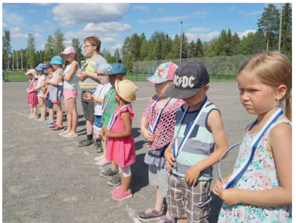
Lasten ja nuorten heittäjien joukko kasvaa ilahduttavasti.