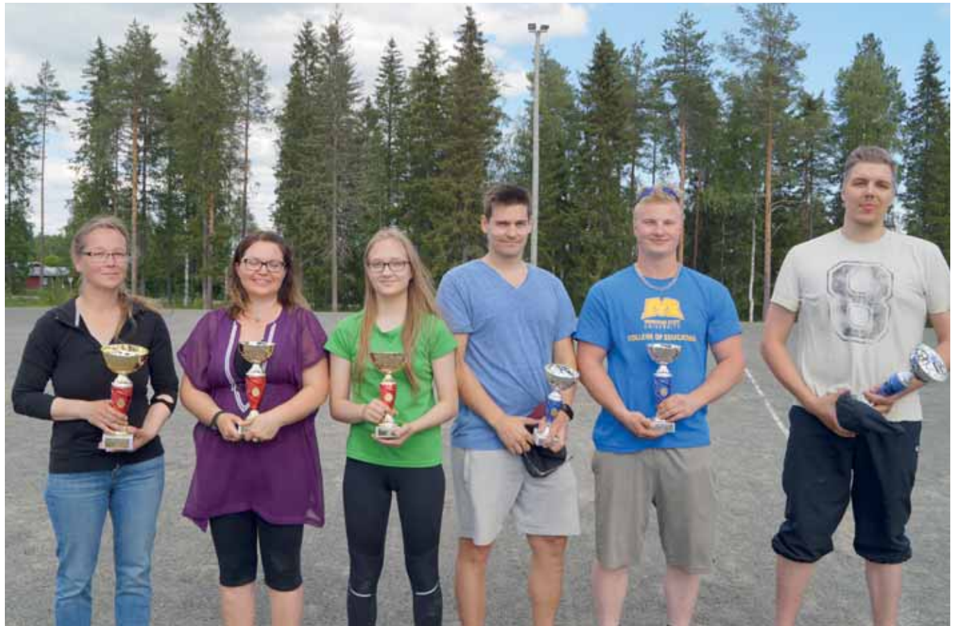
Naisten ja miesten sarjan kovimmat heittäjät saatiin yhteiskuvaan.

Ämpäripäpäivien panostuksessa lapset oli otettu hienosti huomioon. Kisailujen lisäksi Pikku-peikon pesän edessä oli pie-