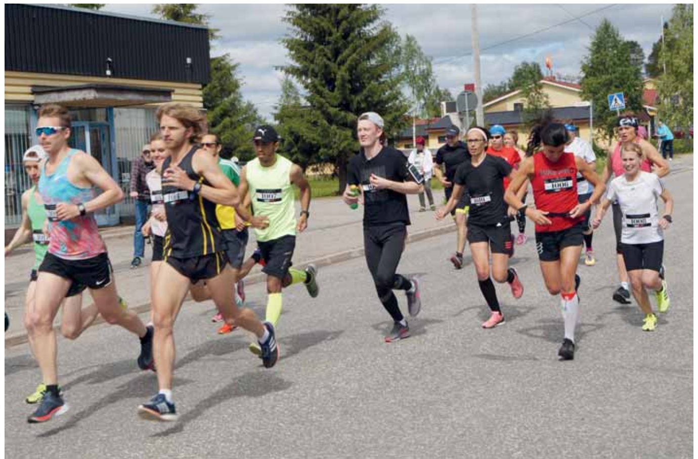
Maratoonarit lähtivät iloisin mielin matkaan.