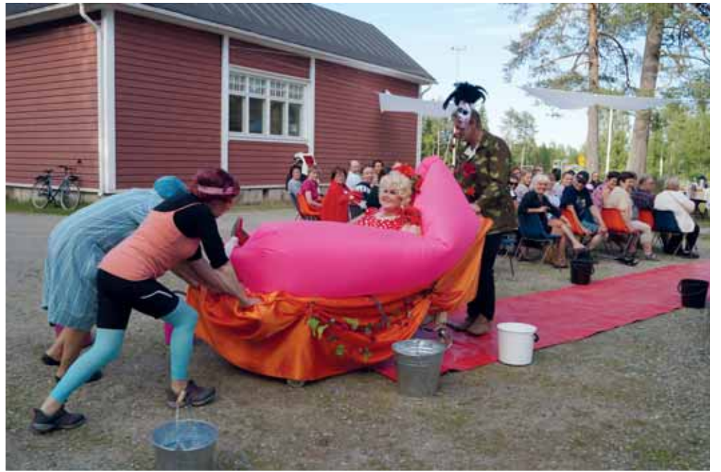
Esikoissisar Anki halusi harjoitella omat hautajaisensa. Hän sai mitä tilasi, ehkä vähän enemmänkin.