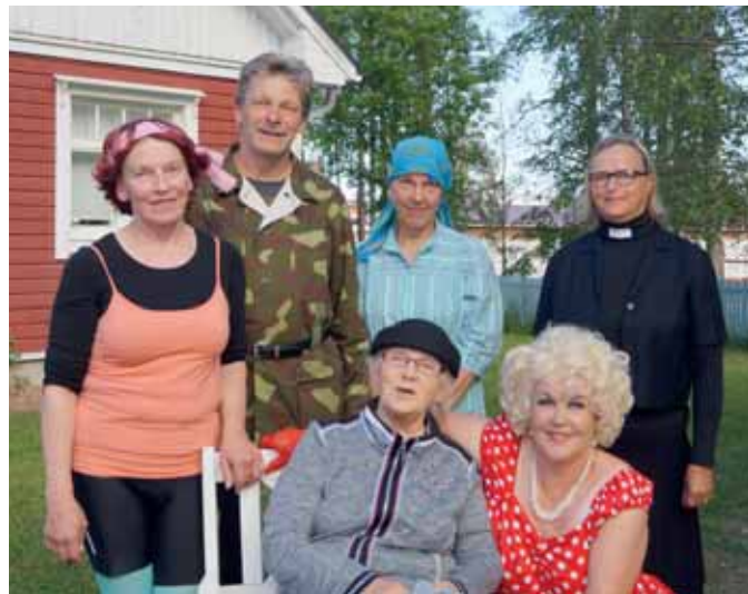
Muistoa kunnioittaen -näytelmän näyttelijäkaarti suoriutui haasteestaan kiittävästi.