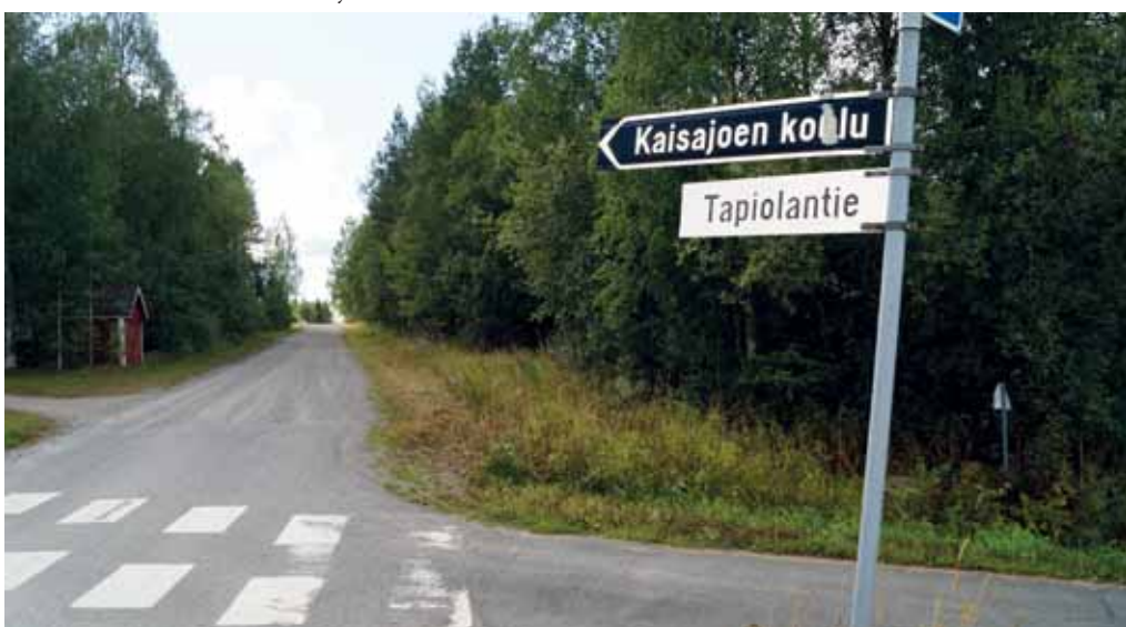
Koulutiellä suojatiet ovat tärkeitä liikenneväylien ylityspaikkoja, mutta automaattisesti ne eivät vielä miltään suojaa elleivät kaikki väylillä liikkuvat tiedosta ja huomioi niiden merkitystä.